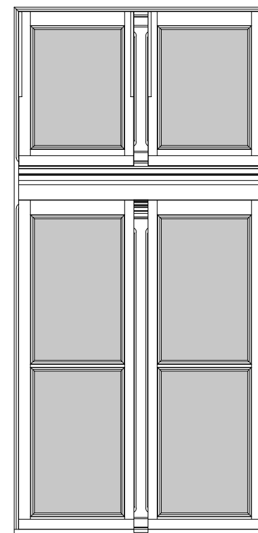
Elevação externa Escala ----- 1/25